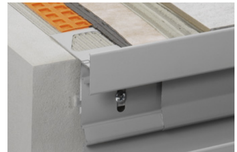
Montaje con Schlüter®-DITRA25 y Schlüter®-BARA-RTKEG

Altura del perfil: _____ mm Color: _____ Ref.: _____ Material: _____ €/m Mano de obra: _____ €/m Precio total: _____ €/m