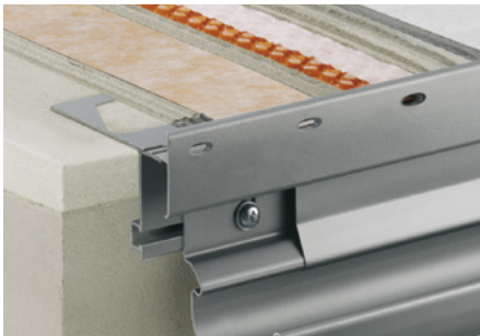
Montaje con Schlüter®-DITRA-DRAIN 4 y Schlüter®-BARA-RTKE