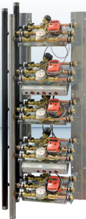
PERDITE DI CARICO MODULO SimeConn Multi \varnothing 3/4" - DN 18 SOLO NUCLEO IDRAULICO