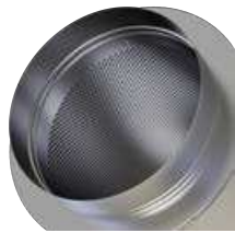
Boca de conexión rápida