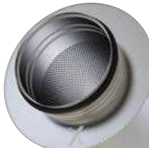
Boca con junta de labio