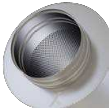
Boca con bordón