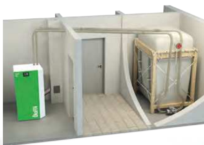
Succión neumática con silo textil