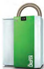
Tolva para llenado manual