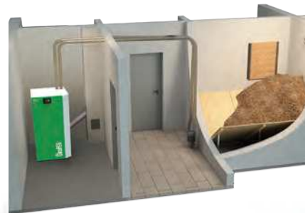
Succión neumática con silo de obra

Nota: La tolva o los silos de pellets pueden estar situados hasta a 20 m de la caldera